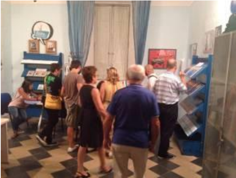
"SPLASH! Archivio Andrea Pazienza", MAT Museo dell'Alto Tavoliere