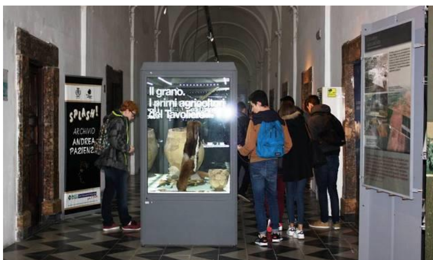
La collezione archeologica del MAT Museo dell'Alto Tavoliere

Visite guidate gratuite alla collezione archeologica, alla Pinacoteca " Luigi Schingo " e a " Splash! Archivio Andrea Pazienza ", centro di documentazione dedicato al celebre fumettista Andrea Pazienza. Le visite sono svolte dagli operatori del Servizio Civile Nazionale e sono indirizzate ad ogni tipo di pubblico: da singoli visitatori a gruppi organizzati, o tipologie di utenti di vario genere.