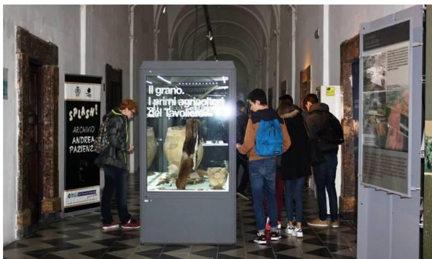
La collezione archeologica del MAT Museo dell'Alto Tavoliere

Visite guidate gratuite alla collezione archeologica, alla Pinacoteca " Luigi Schingo " e a " Splash! Archivio Andrea Pazienza ", centro di documentazione dedicato al celebre fumettista Andrea Pazienza. Le visite sono svolte dagli operatori del Servizio Civile Nazionale e sono indirizzate ad ogni tipo di pubblico: da singoli visitatori a gruppi organizzati, o tipologie di utenti di vario genere.