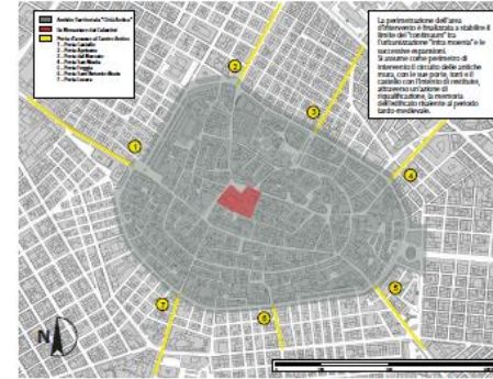
AMBITO TERRITORIALE CITTA' ANTICA