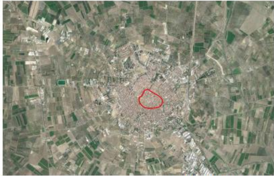
AEROFOTOGRAMMETRIA SAN SEVERO